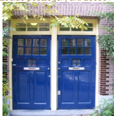
Rombout Hogerbeetsstraat 2-hs