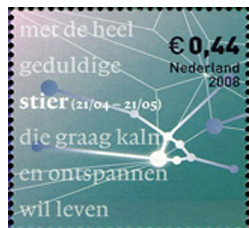
TNT-Post Zodiac-postzegel | art: 280961